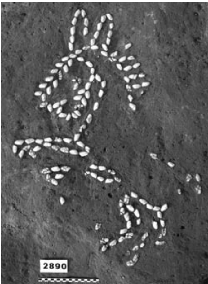
Fig. 3 : Décor de sol de terre battue de l'îlot 35 de Lattes réalisé à l'aide de coquillages (tellines) et représentant un équidé, probablement un âne (Us 35381, fin du IIe s. av. n. è.).

au Caillar dans le Gard ou à Pech-Maho dans l'Aude) ou sont à développer (comme à Espeyran à Saint-Gilles-du-Gard).