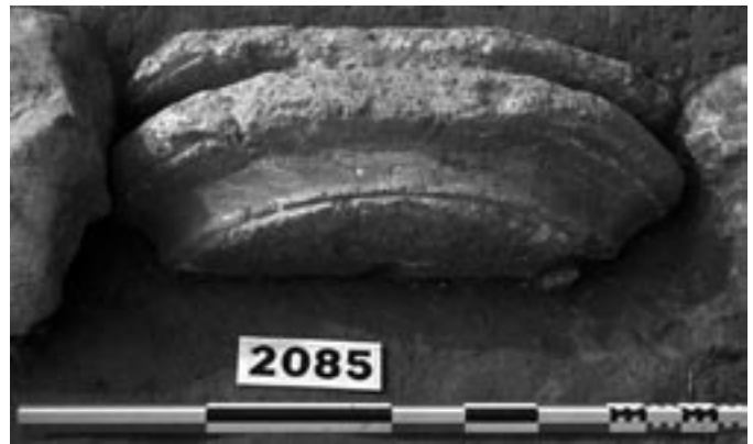
Fig. 4 : Base de colonne corinthienne (SB26152) en réemploi en bordure d'un hangar du port de Lattes, témoin de l'existence de monuments publics sur le site au Ier s. av. n. è.

On a également souligné l'intérêt qu'il y avait à mettre cette évolution de l'habitat privé en relation avec d'autres indices concernant la communauté dans son ensemble : on rappellera notamment sur ce thème les transformations affectant contemporanément la courtine méridionale de l'enceinte qui est alors flanquée d'une série de tours carrées régulièrement réparties. Ces constructions accentuent, plus peut-être que l'efficacité défensive, la monumentalité de l'ouvrage, remettant du même coup une vieille enceinte à la mode du temps : et l'on ne s'étonnera pas que cette affirmation symbolique concerne la façade de la ville tournée vers la mer. On rappellera également la mise en chantier à partir de cette époque de grands travaux de voirie, matérialisés par des apports massifs de galets pour conforter la bande de rou-