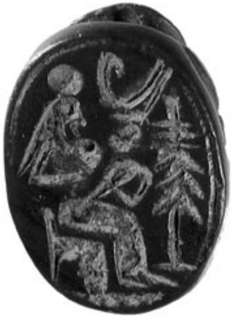
Fig. 1 : Scarabée égyptien figurant Isis allaitant Pharaon enfant, coiffé de la double couronne, provenant d'un niveau du milieu du Ve s. av. n. è. de l'îlot 1 de Lattes (Us 53060).