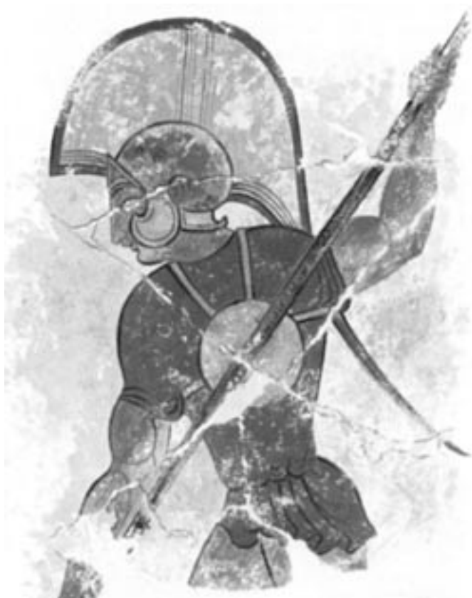
Fig.10 : Peinture représentant un guerrier étrusque muni d'un disque-cuirasse, d'une tombe de Ceri, Italie (d'après Connolly 1981, p.98, fig.14).

Affirmer l'appartenance de la statue de Lattes au groupe culturel du Languedoc oriental, et supposer (sous réserve des précisions que pourra éventuellement fournir l'analyse de la pierre) qu'il s'agit d'une œuvre locale ou régionale, ne dispense pas d'envisager les diverses influences dont témoigne cette sculpture. Or les comparaisons qu'appellent ce guerrier et son équipement portent essentiellement vers la Méditerranée, et fort peu vers le continent hallstattien ou celtique.