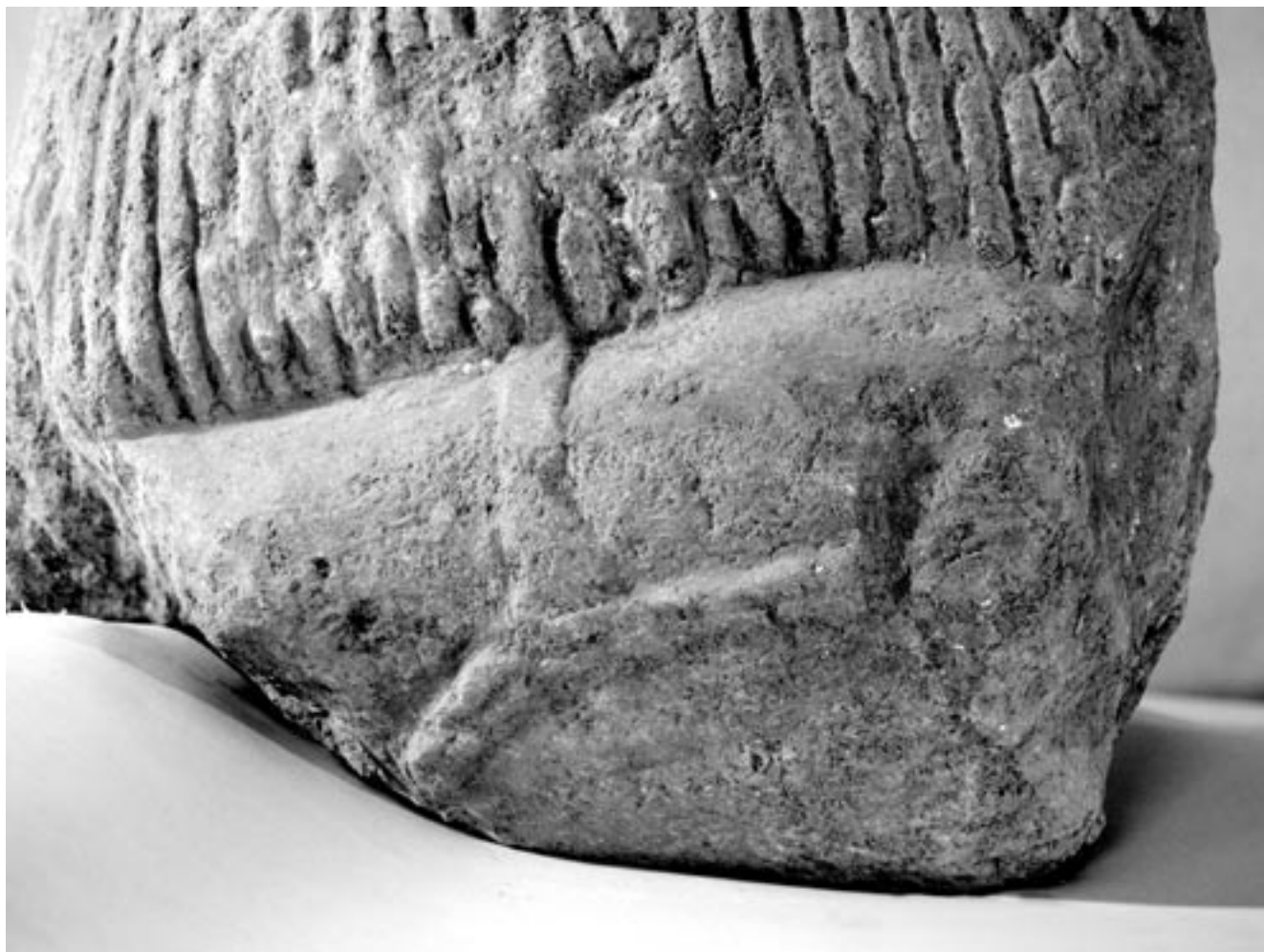
Fig. 8 : Jambe droite repliée sous la jupe plissée, avec cnémide à bord décoré.

plusieurs indices tirés de la typologie des pièces de harnachement.