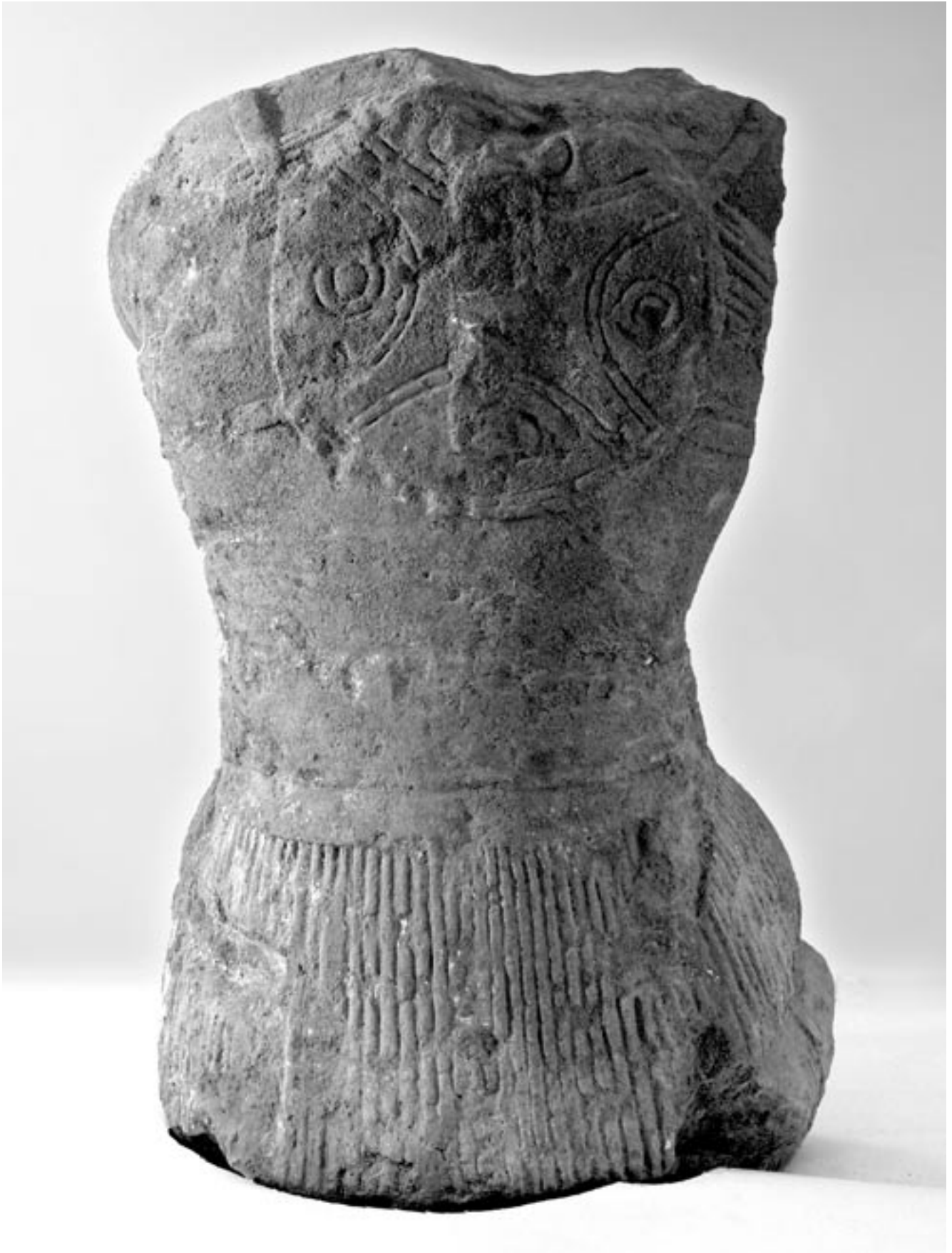
Fig. 3 : La statue de guerrier de Lattes vue de dos.