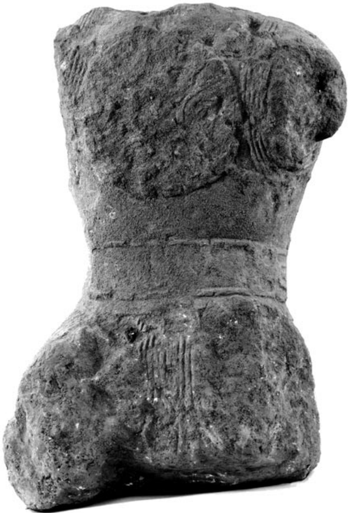
Fig. 1 : La statue de guerrier de Lattes vue de face.