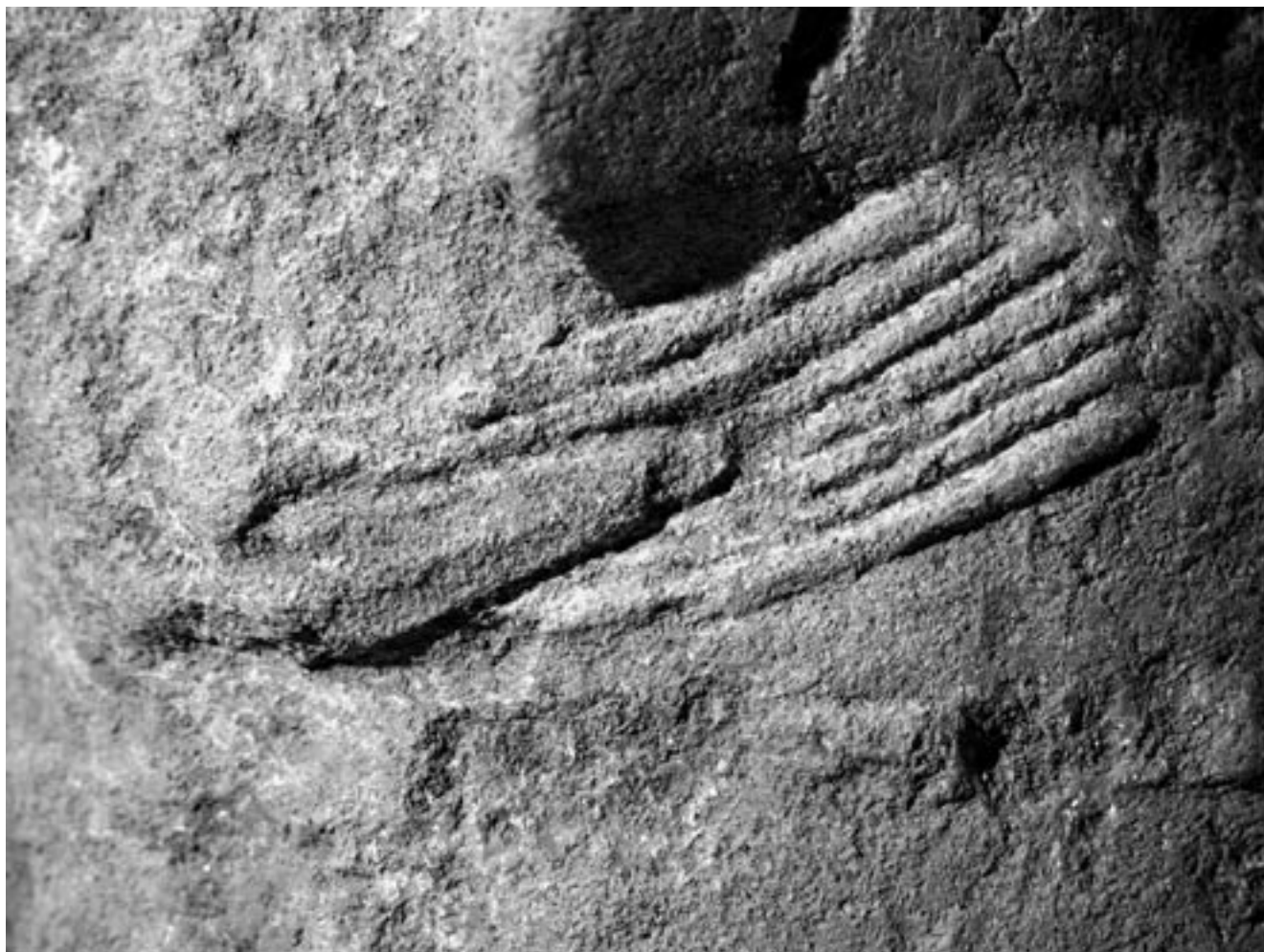
Fig. 6 : Bandeau mouluré sous l'aisselle gauche et son agrafe à tête triangulaire.

dont la largeur varie de 1,8 à 2,2 cm (fig.2 et 4). Ces sangles, se surimposant au bandeau cannelé, passent d'une part au sommet des épaules, d'autre part au milieu du torse et entourent donc les bras. Sur l'épaule gauche, un bandeau lisse plus large est connecté à l'une des sangles et reste difficile à interpréter.