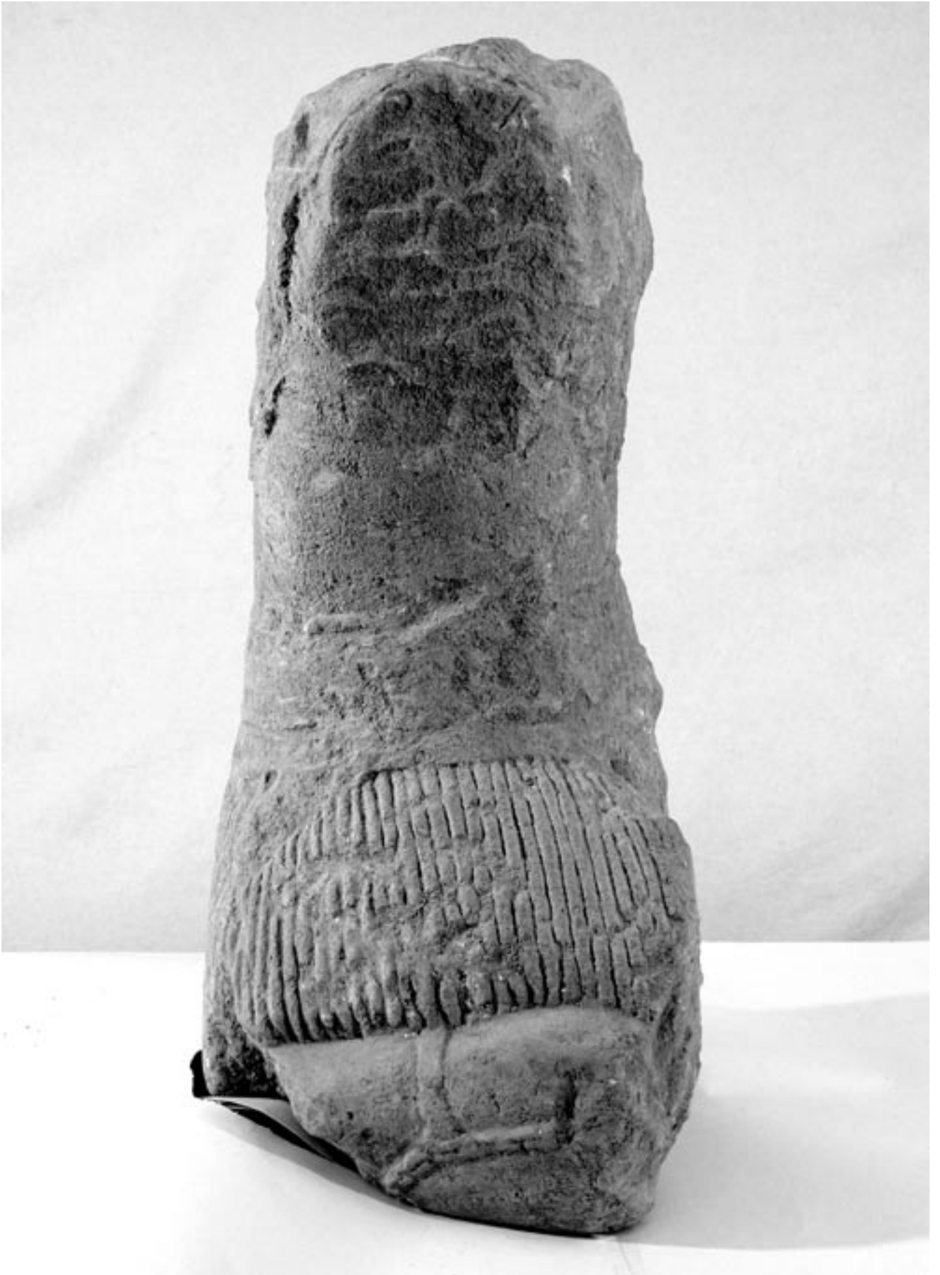
Fig. 2 : La statue de guerrier de Lattes vue du côté droit.