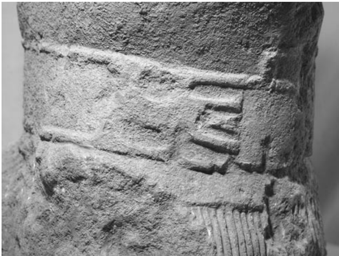
Fig. 5 : Détail de la ceinture à bord ourlé et de l'agrafe à trois crochets de la statue de guerrier de Lattes.

le bas (1,1 cm en moyenne). Cette jupe tombe verticalement à l'arrière, ainsi qu'à l'avant entre les jambes (9 plis sur 8 cm de large), tandis que de part et d'autre elle épouse le modelé des cuisses.