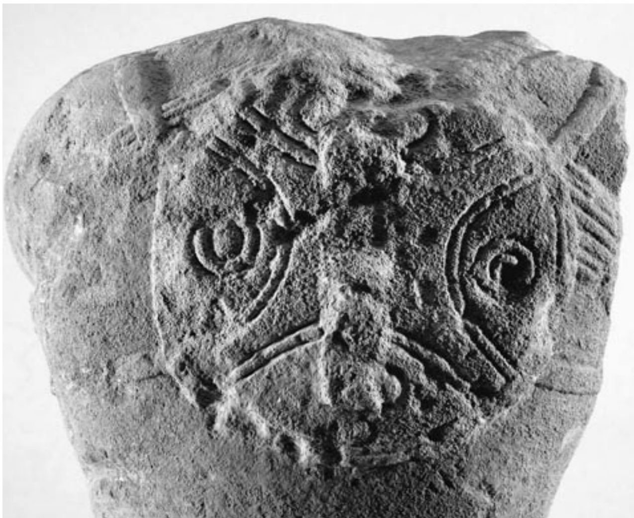
Fig. 7 : Détail du disque dorsal décoré, et de l'arrachement du cimier du casque.

À un moment si proche de la découverte et au début d'une enquête que l'on ne peut ici qu'amorcer, il ne pourra s'agir que d'indications sommaires, qui mériteront ultérieurement consolidation et compléments.