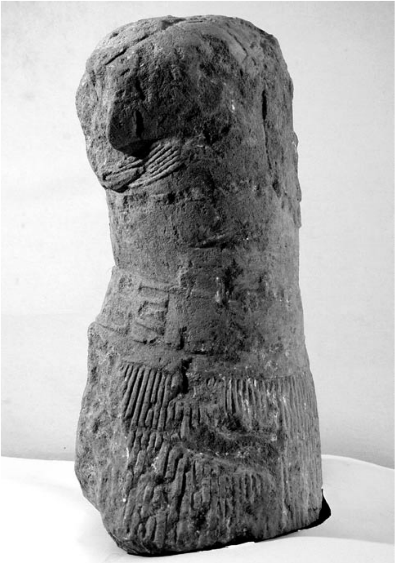
Fig. 4 : La statue de guerrier de Lattes vue du côté gauche.